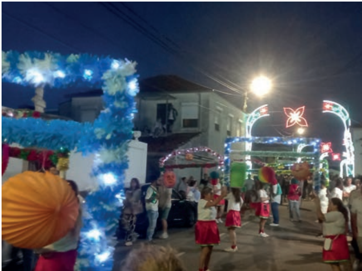
As marchas sanjoaninas animaram o Campo Grande

Ao nível dos espaços disponibilizados, verificamos a presença de roulottes