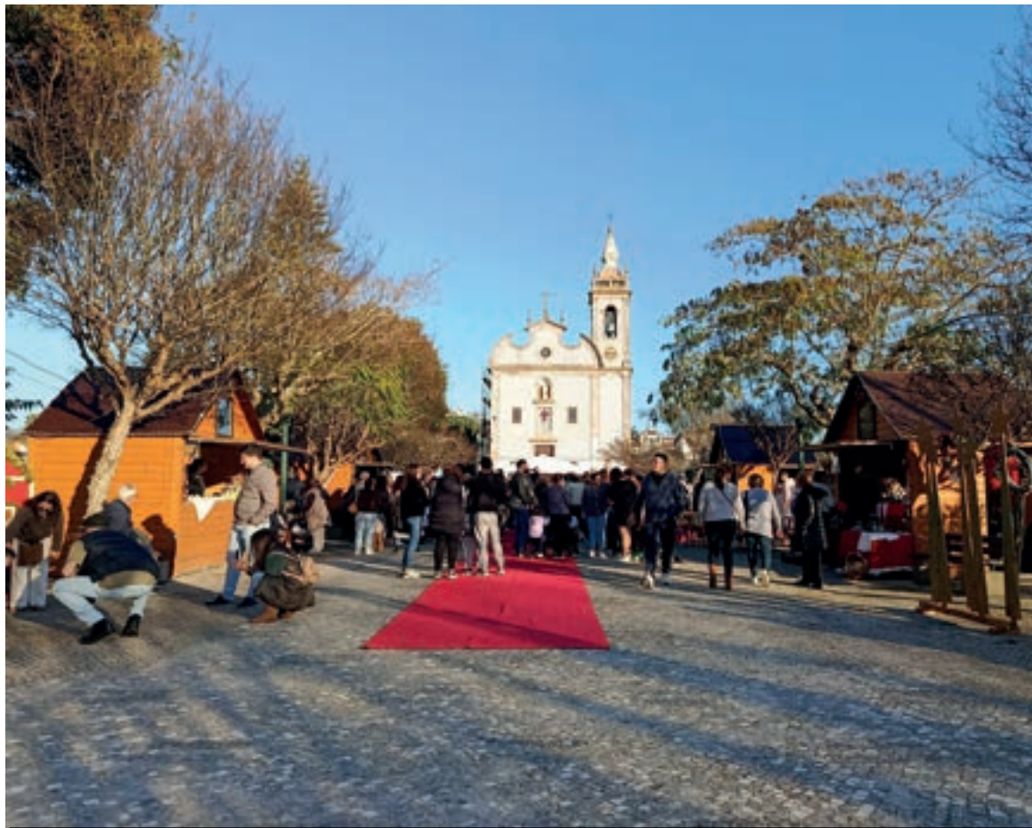
O Adro da Igreja Matriz tem vindo a motivar a adesão da comunidade

Os espetáculos corais tiveram especial destaque, com atuações do Grupo Coral Nós P'ra Voz (AFPA), da Escola de Música do Grupo Coral de Esmoriz, do Grupo Coral dos Pequenos Cantores e do Grupo Coral das 10. Estes momentos, realizados maioritariamente no adro da Igreja