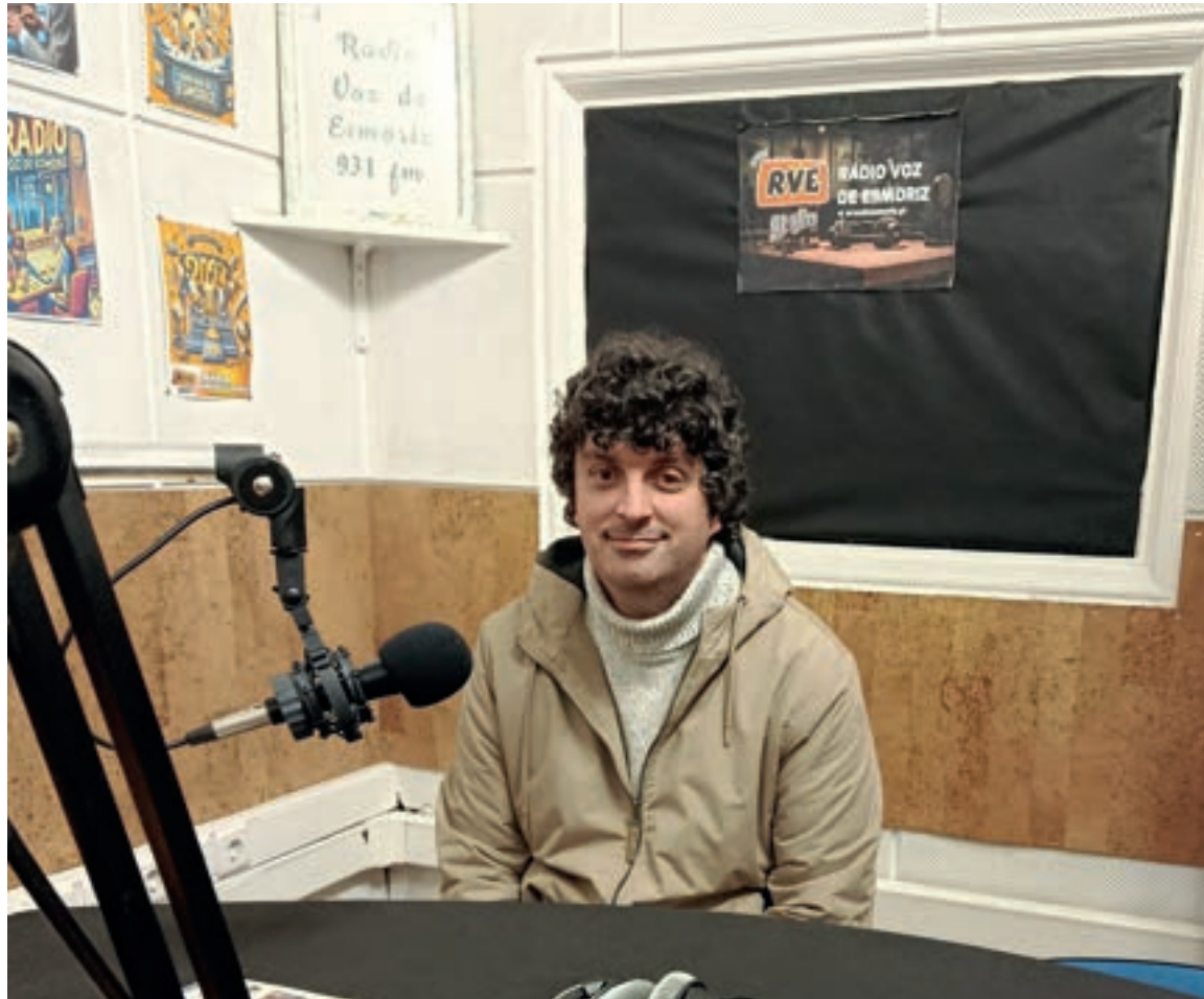
O Arraial da Barrinha e os concursos de fotografia "Esmoriz aos teus olhos" foram apostas da CME