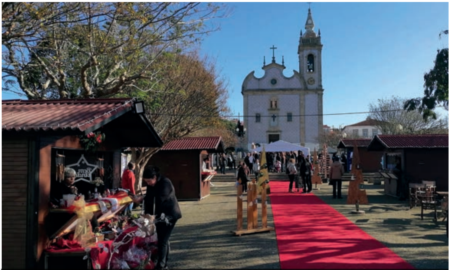
Mercadinho de Natal tem sido realizado durante os fins-de-semana de Dezembro no centro da cidade

No dia 7 de Dezembro (um sábado de manhã), decorreu a abertura do Mercadinho de Natal no Adro da Igreja Matriz de Esmoriz, espaço pontuado por seis palheiros (onde se podem consumir bebidas, bolos e iguarias e adquirir ornamentos natalícios), além de um mural natalício colocado à entrada, onde as pessoas e, em particular, os mais novos, podem tirar algumas fotografias. Ao longe, já perto da escadaria da Igreja, foi consubstanciada uma grande tenda, a fim de acolher as actividades e os espectáculos que se encontram agendados no âmbito da programação "Natal na Cidade", organizada pela Junta de