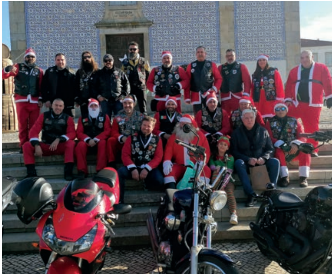
A associação animou o Mercadinho de Natal de 2024

JM – E temos um amigo no grupo motard aqui vizinho, de São Félix da Marinha, que vem sempre fazer de Pai Natal, já é um grande amigo do grupo, e disponibilizou-se para vir fazer o pequeno passeio da sede até aqui para tirar fotografias com os miúdos, porque ele tem barba e cabelo verdadeiro, é mesmo um pai natal que temos no Mercadinho de Natal. Nós lançámos o convite nas redes sociais, convidámos