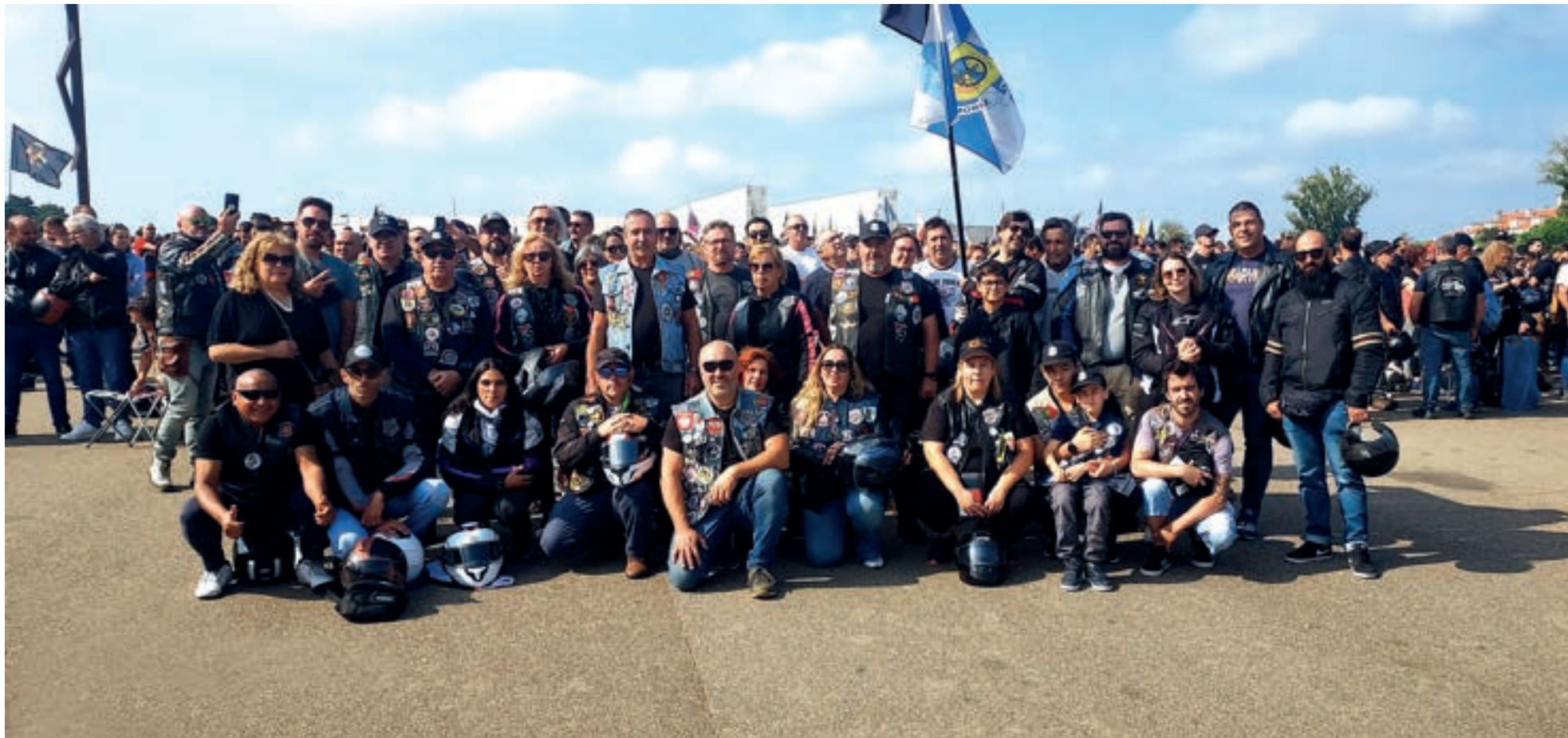
O Grupo Motard de Esmoriz voltou a marcar presença, mais um ano, na Bênção dos Capacetes em Fátima

GRUPO MOTARD DE ESMORIZ NASCEU DA AMIZADE DE DOIS VIZINHOS, TENDO SIDO FUNDADO EM 2019