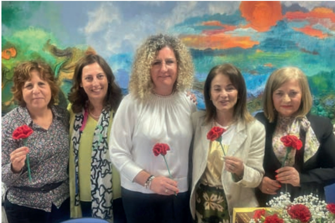
Escola Secundária de Esmoriz assinalou os 50 anos do 25 de Abril