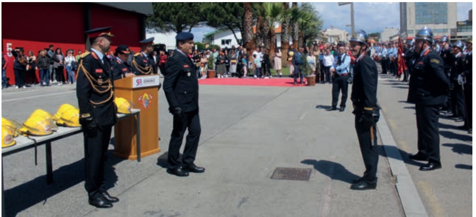
Os portões 5 e 6 são resultado da ampliação do parque de viaturas e foram uma das prendas dos 93 anos

Da parte da tarde, decorreram as acções de formatura e as condecorações em parada (com medalhas de terceiro, segundo grau, grau de prata, etc), além de se registar, logo de início, o ingresso de novos bombeiros voluntários nesta corporação que, após prestarem o seu juramento, deixaram assim de ser estagiários para abraçarem a causa singular de ajudar os outros. Houve ainda a recepção às