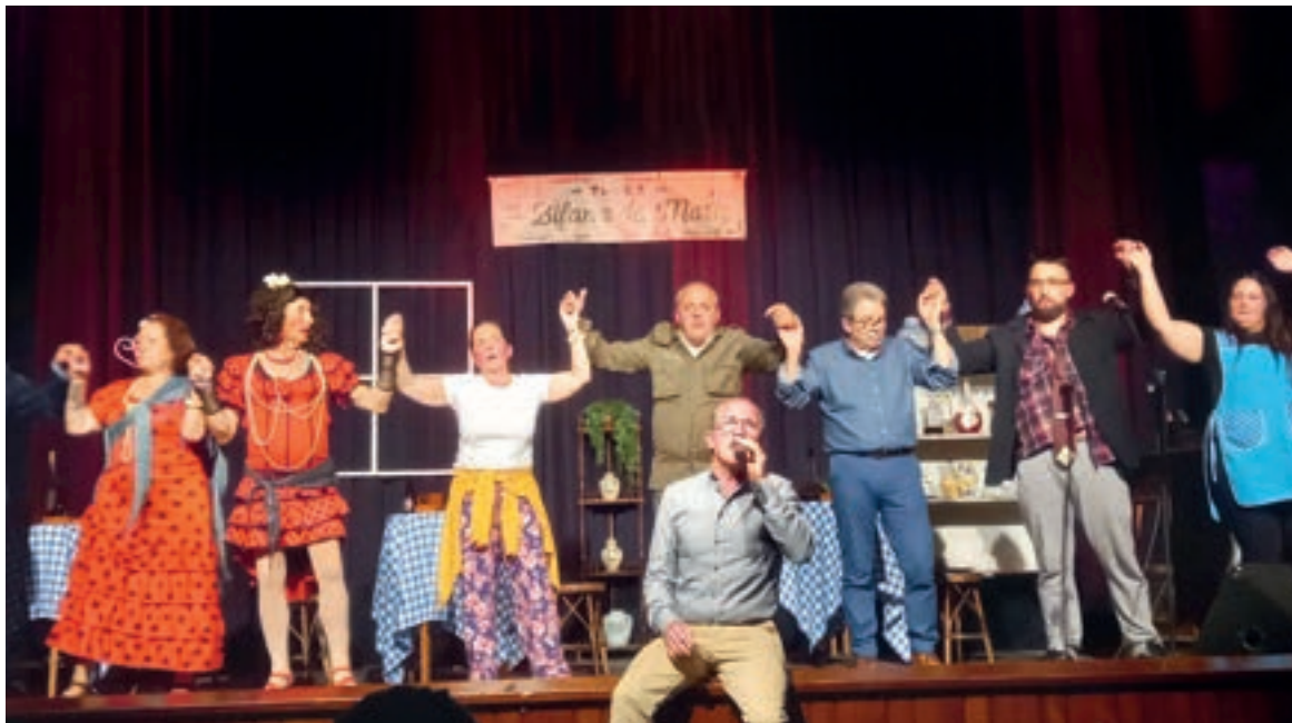
"A Bifana da Maria" juntou um elenco que fez rir a plateia