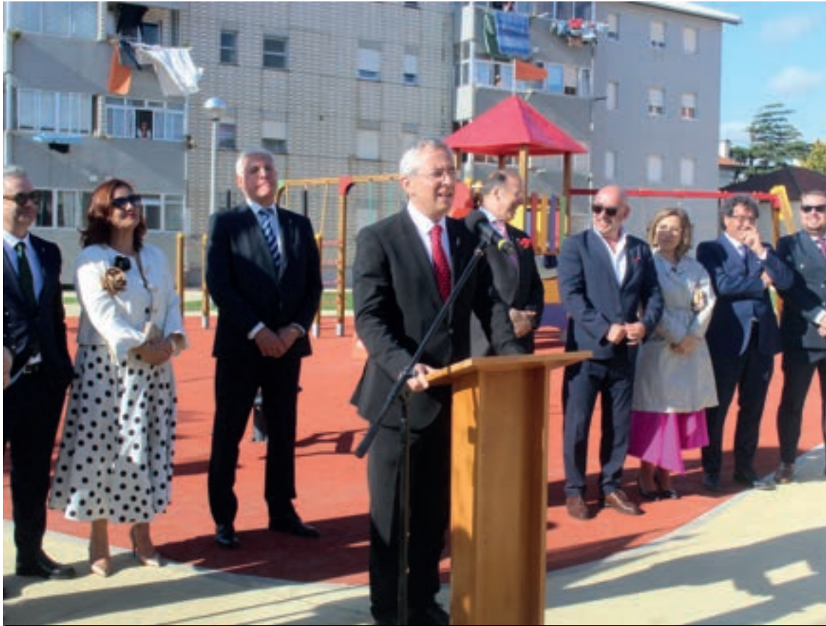
O presidente da autarquia esteve presente na inauguração da requalificação do Bairro de São Luís

Eu direi nos próximos anos, vai para além deste mandato, é o que é... As coisas não se conseguem fazer no período de quatro anos de uma forma estanque, mas Esmoriz vai ter outras obras até ao final do mandato,